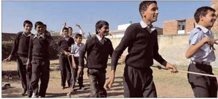
» धौलपुर... मयूरी विशेष विद्यालय में आयोजित खेल प्रतियोगिता में उत्साह से भाग लेते निराक बच्चे

समारोह को सम्बोधित करते हुए जिला कलेक्टर ने कहा कि हम विशेष बच्चों को आत्म निर्भर बनाये यह बच्चे सामान्य बच्चों से ज्यादा अनुशासित होते हैं।